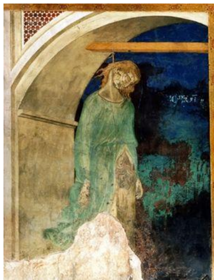
Giuda impiccato, Pietro Lorenzetti, Basilica inferiore, Assisi.

Va' dov'erano ancora radunati i capi del popolo, quelli che l'avevano comperato, quella da cui si era lasciato comperare. Ha in mano la borsa, prende i trenta denari, glieli butta, prendete, è il prezzo del sangue del Giusto. Una rivelazione di fede, aveva misurato la gravità del suo misfatto. Non contavano più questi denari. Aveva fatto tanti calcoli, su questi denari. Il denaro. Trenta denari. Che cosa importa della coscienza, che cosa importa essere cristiani? Che cosa ci importa di Dio? Dio non lo si vede, Dio non ci da' da mangiare, Dio non ci fa' divertire, Dio non da' la ragione della nostra vita. I trenta denari. E non abbiamo la forza di tenerli nelle mani. E se ne vanno. Perché dove la coscienza non è tranquilla anche il denaro diventa un tormento. C'è un gesto, un gesto che denota una grandezza umana. Glieli butta là. Credete voi che quella gente capisca qualche cosa? Li raccoglie e dice: "Poiché hanno del sangue, li mettiamo in disparte. Compereremo un po' di terra e ne faremo un cimitero per i forestieri che muoiono durante la Pasqua e le altre feste grandi del nostro popolo". Così la scena si cambia, domani sera qui, quando si scoprirà la croce, voi vedrete che ci sono due patiboli, c'è la croce di Cristo; c'è un albero, dove il traditore si è impiccato.