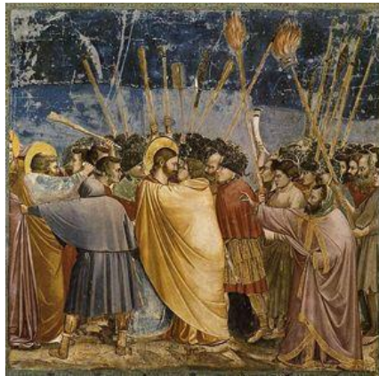
Il bacio di Giuda e la cattura di Gesù, Giotto, Cappella degli Scrovegni, Padova.

rimangono sempre gli amici. Noi possiamo tradire l'amicizia del Cristo, Cristo non tradisce mai noi, i suoi amici; anche quando non lo meritiamo, anche quando ci rivoltiamo contro di Lui, anche quando lo neghiamo, davanti ai suoi occhi e al suo cuore, noi siamo sempre gli amici del Signore.