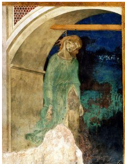
Giuda impiccato, Pietro Lorenzetti, Basilica inferiore, Assisi.

Va' dov'erano ancora radunati i capi del popolo, quelli che l'avevano comperato, quella da cui si era lasciato comperare. Ha in mano la borsa, prende i trenta denari, glieli butta, prendete, è il prezzo del sangue del Giusto. Una rivelazione di fede, aveva misurato la gravità del suo misfatto. Non contavano più questi denari. Aveva fatto tanti calcoli, su questi denari. Il denaro. Trenta denari. Che cosa importa della coscienza, che cosa importa essere cristiani? Che cosa ci importa di Dio? Dio non lo si vede, Dio non ci da' da mangiare, Dio non ci fa' divertire, Dio non da' la ragione della nostra vita. I trenta denari. E non abbiamo la forza di tenerli nelle mani. E se ne vanno. Perché dove la coscienza non è tranquilla anche il denaro diventa un tormento. C'è un gesto, un gesto che denota una grandezza umana. Glieli butta là. Credete voi che quella gente capisca qualche cosa? Li raccoglie e dice: "Poiché hanno del sangue, li mettiamo in disparte. Compereremo un po' di terra e ne faremo un cimitero per i forestieri che muoiono durante la Pasqua e le altre feste grandi del nostro popolo". Così la scena si cambia, domani sera qui, quando si scoprirà la croce, voi vedrete che ci sono due patiboli, c'è la croce di Cristo; c'è un albero, dove il traditore si è impiccato.