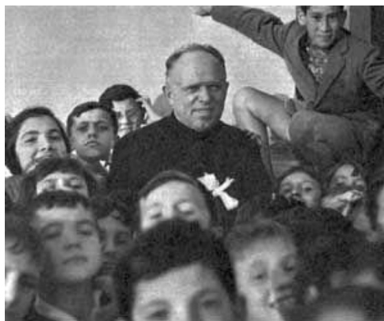
Don Primo Mazzolari tra i ragazzi di Bozzolo.

Perdonatemi se questa sera che avrebbe dovuto essere di intimità, io vi ho portato delle considerazioni così dolorose, ma io voglio bene anche a Giuda, è mio fratello Giuda. Pregherò per lui anche questa sera , perché io non giudico, io non condanno; dovrei giudicare me, dovrei condannare me. Io non posso non pensare che anche per Giuda la misericordia di Dio, questo abbraccio di carità, quella parola amico, che gli ha detto il Signore mentre lui lo baciava per tradirlo, io non posso pensare che questa parola non abbia fatto strada nel suo povero cuore. E forse l'ultimo momento, ricordando quella parola e l'accettazione del bacio, anche Giuda avrà sentito che il Signore gli voleva ancora bene e lo riceveva tra i suoi di là. Forse il primo apostolo che è entrato insieme ai due ladroni. Un corteo che certamente pare che non faccia onore al figliolo di Dio, come qualcheduno lo concepisce, ma che è una grandezza della sua misericordia.