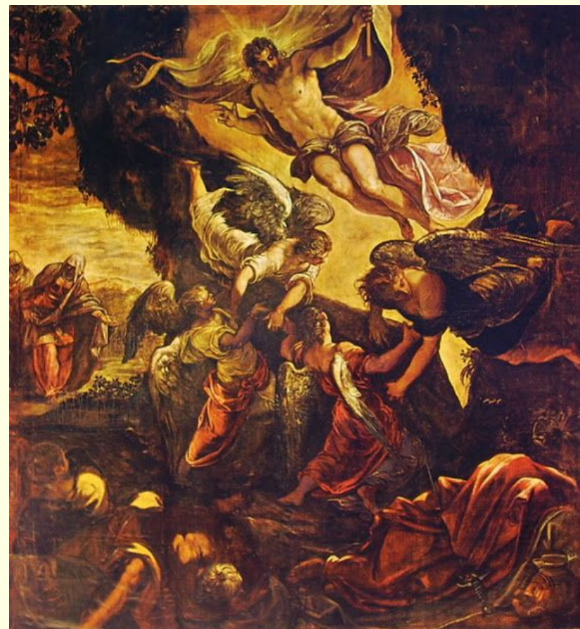
La Resurrezione del Tintoretto (Jacopo Robusti) 1578-1581 Scuola di San Rocco - Venezia - cm 529x485